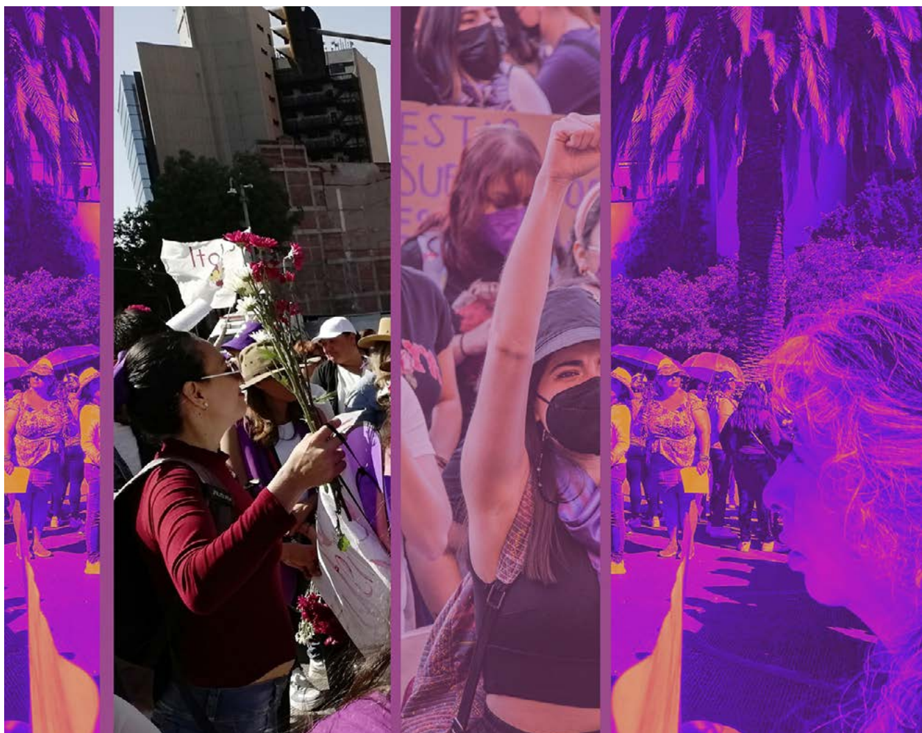
8M, gráfica digital, Natalia Eguiluz, 2023.

Como bien lo popularizó el uruguayo Eduardo Galeano finado en 2015, las utopías son horizontes de esperanza hacia la construcción de realidades más justas e igualitarias. En el transcurso del caminar hacia la utopía, cuando ya casi se está por llegar, el horizonte se mueve unos pasos más allá, por lo que la utopía sirve para caminar.