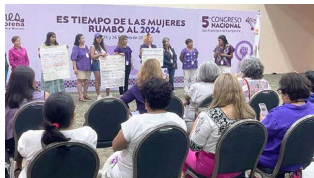
Campeche 2023.

* Feminista, Politóloga, Maestra en Estudios de la mujer y Consejera Nacional de morena.