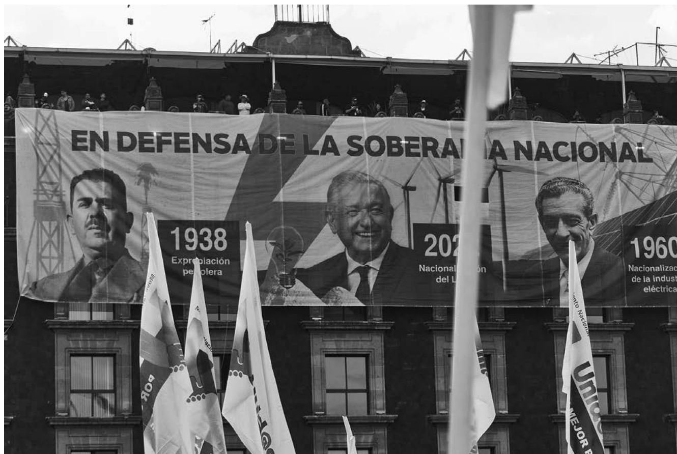
Zócalo, 18 de marzo 2023

libres, para apoyar al hoy presidente de México Andrés Manuel López Obrador quien invitó a todos los mexicanos a conmemorar este hecho histórico de la expropiación petrolera "... porque se enfrentó a intereses foráneos y también a quienes se oponían en ese entonces a la política popular y patriótica del general Lázaro Cárdenas". 2