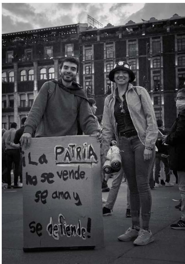
Zócalo, 18 de marzo 2023.

mexicanas. Por ejemplo, denunció el caso de “Calilao 4” un campo petrolero donde más de 200 mujeres se quejaron porque sus hijos ya no eran admitidos en la escuela de la compañía petrolera, debido a que sus maridos habían sido despedidos por decidir sindicalizarse para defender sus derechos.