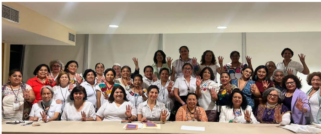
Campeche, 2023.

ONU Mujeres (2018), Guía estratégica empoderamiento político de las mujeres: Marco para una acción estratégica .