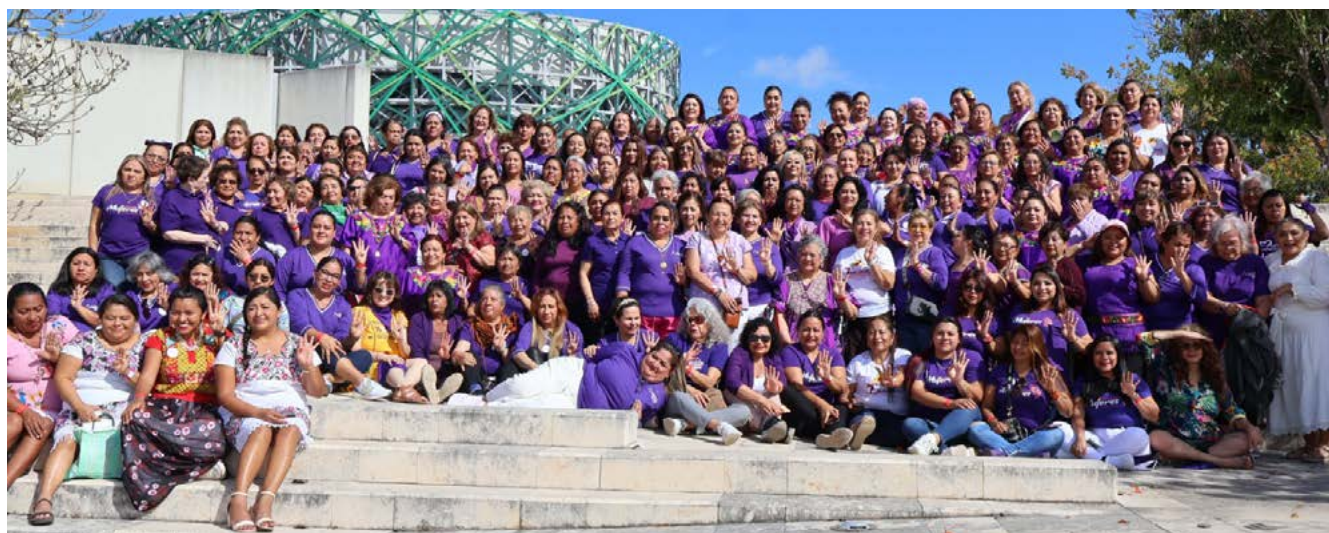
Mérida, Yucatán, 2025

La Colectiva Mujeres Morena República, conformada por mujeres militantes y liderazgos de todo el país, llevó a cabo su Séptimo Congreso Nacional de Mujeres Morena República, organizado por las referentes de los estados de Campeche, Quintana Roo y Yucatán. El evento tuvo lugar los días 15 y 16 de febrero de 2025, en la ciudad de Mérida, Yucatán.