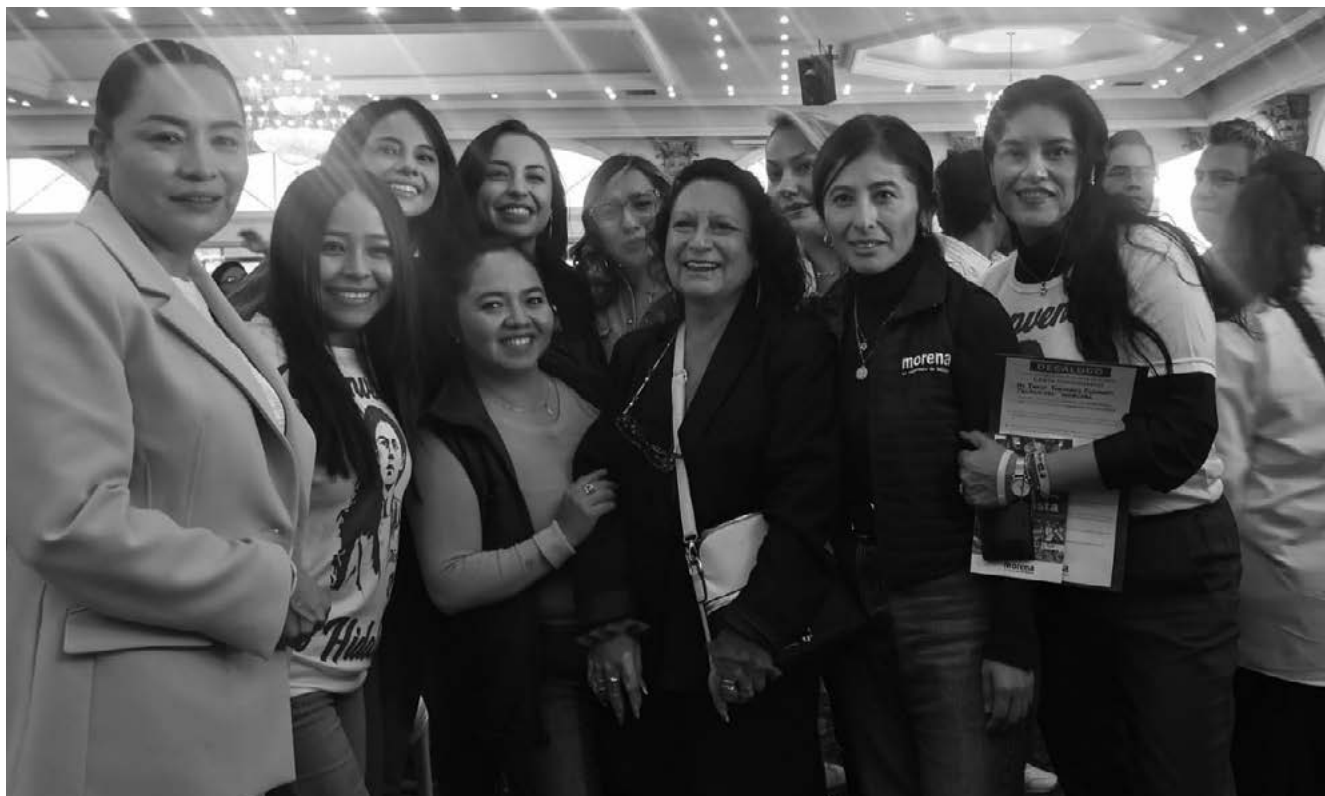
Reunión Pachuca Hgo, 2024.

de conducta de hombres y mujeres para erradicar los prejuicios que perpetúan la idea de inferioridad femenina.