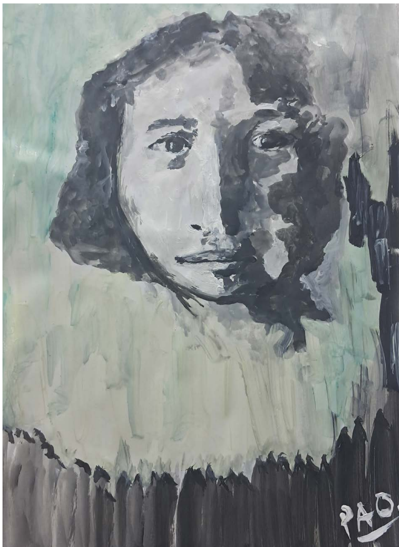
Título: Mujer interminable. Autora: Paola Trincado. Técnica: Acrílico sobre papel. Año: 2025