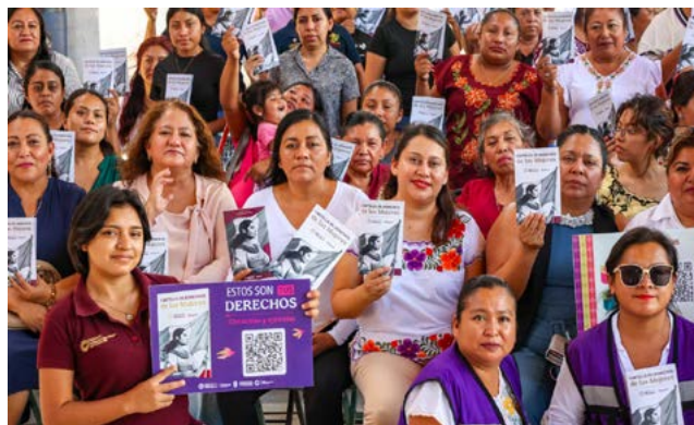
Foto: Cortesía de IMEF, 2025. Asamblea Chiapas, Voces por la igualdad y contra las violencias

La doctora Claudia Sheinbaum está comprometida con la transformación en favor del bienestar de todas las mujeres, en todos los ámbitos: la erradicación de la violencia y los feminicidios, el fortalecimiento de la economía de las mujeres y el cuidado de su salud física. Por ello, cuenta con nuestro respaldo para continuar haciendo historia en México.